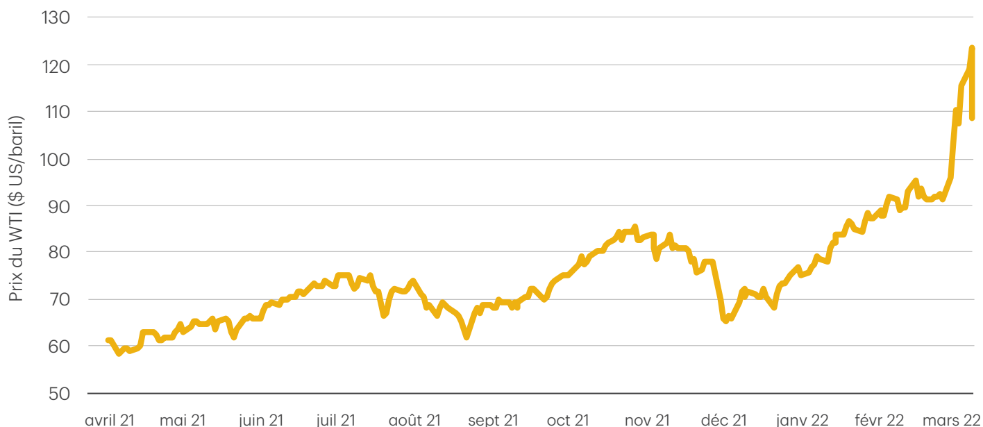
Graphique 2 : Le pétrole poursuit son ascension constante

Source : Prix du pétrole brut WTI ($/baril), FactSet. Au 7 mars 2022.