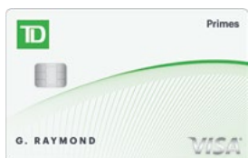
Carte Visa* Primes TD