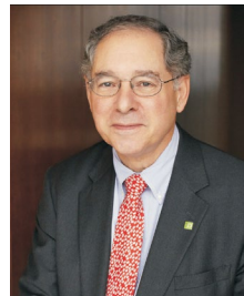
Bharat Masrani Président du Groupe et chef de la direction